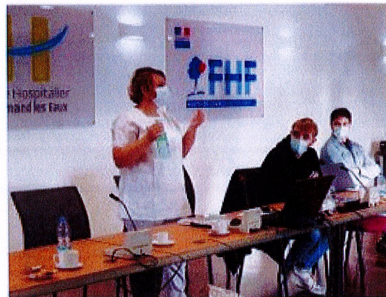
Le centre hospitalier de Saint-Amand-les-Eaux a créé un nouveau métier dans les EHPAD, lundi. Il a embauché six jeunes demandeurs d'emploi pour qu'ils maintiennent le lien social entre les résidents et leur famille, afin d'éviter le phénomène de glissement trop observé lors du premier confinement.

PAR MURIELLE TISON-NAVEZ valenciennes@lavoixdunord.fr