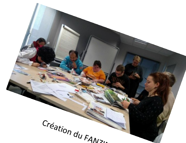
Création du FANZINE