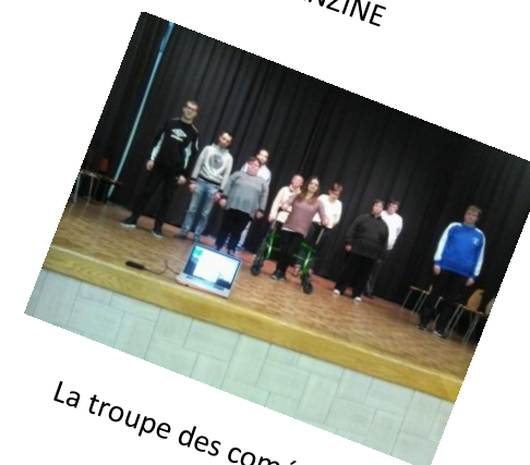
La troupe des comédiens