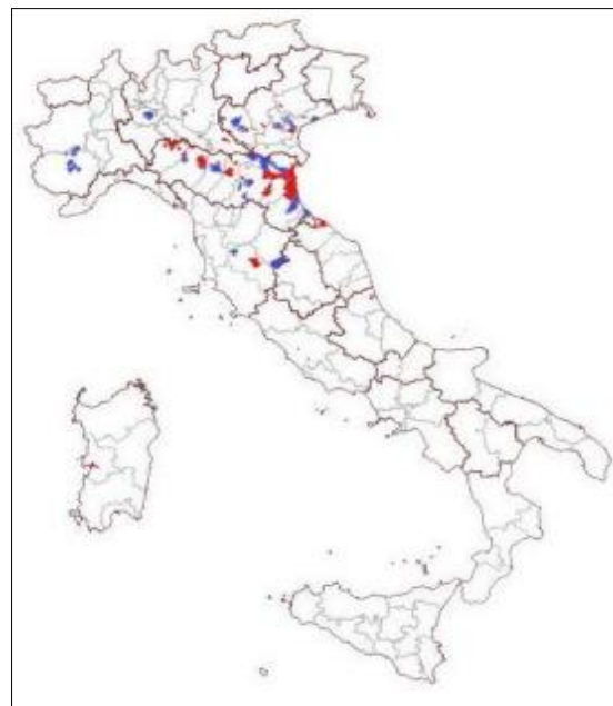
Figure 3 : Distribution géographique des échantillons aviaires et entomologiques positifs USUTU en Italie en 2023 de de l'USUV

Seule l'Italie rapporte publiquement les résultats 2 de surveillance USUV : en 2023 USUV a été identifié dans 65 pools de moustiques et 81 oiseaux dans 8 régions (sur la carte en rouge: moustique, bleu : oiseaux).